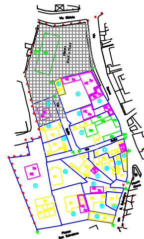
(B) SISTEMAZIONE PREVISTA